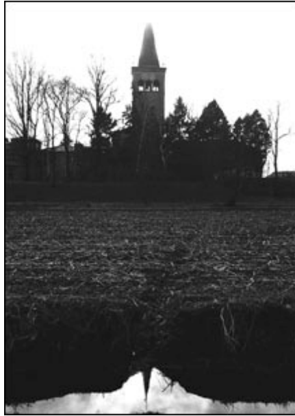
Uno scorcio del monastero benedettino femminile di Viboldone, nel Comune di San Giuliano Milanese, a pochi chilometri dal capoluogo lombardo.