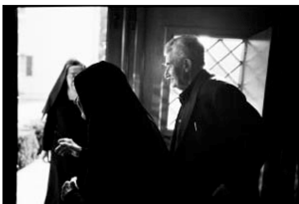
Il sacerdote insieme con alcune suore benedettine di Viboldone.