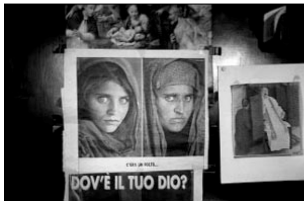
«Dov'è il tuo Dio?». La domanda, che rimbalza dal manifesto appeso nella stanza di don Luisito, è la stessa che attraversa, in vari modi, le pagine del sacerdote.

Più difficile invece dire come la stesura del romanzo si iscrivesse in questo percorso spirituale. Qui occorre spendere almeno alcune parole su La messa dell'uomo disarmato , che porta come sottotitolo Un romanzo sulla resistenza . Resistenza assume un doppio significato, in quanto è da una parte racconto della lotta partigiana e dall'altra categoria spirituale che indica la capacità di riconoscere la presenza di Dio, della Parola, anche in fatti così tragici e violenti.