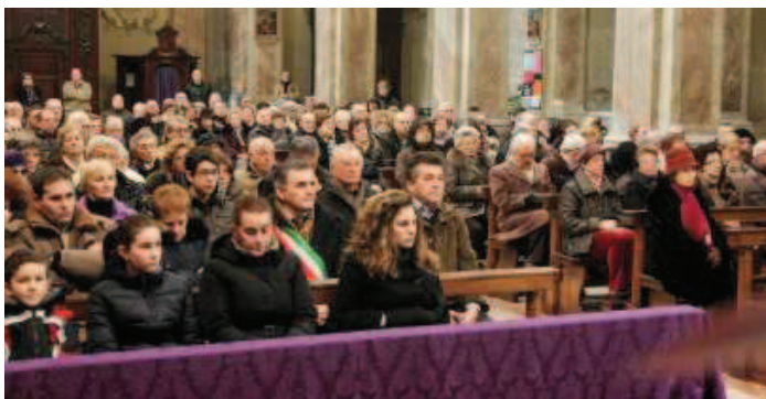
La chiesa di San Leonardo gremita per l'ultimo saluto al sacerdote vescovantino morto a 84 anni